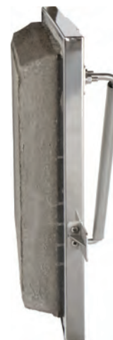
Porte étanche avec ciment réfractaire