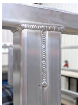
Soudures de qualité