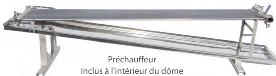
Préchauffeur inclus à l'intérieur du dôme